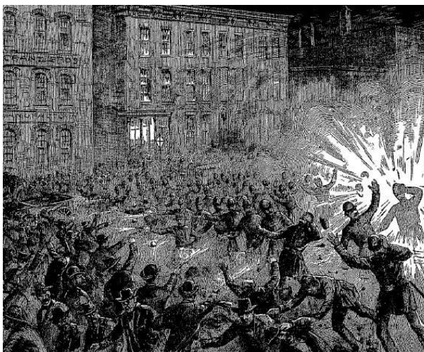
Haymarket, explosión del 4 de mayo de 1886. El 1 de mayo de 1886, 200.000

El 11 de noviembre de 1887 se consumó la ejecución de Albert Parsons (estadounidense, 39 años, periodista), August Spies (alemán, 31 años, periodista), Adolph Fischer (alemán, 30 años, periodista) y Georg Engel (alemán, 50 años, tipógrafo). Louis Linng (alemán, 22 años, carpintero) se había suicidado antes en su propia celda. A Michael Swabb (alemán, 33 años, tipógrafo) y Samuel Fielden (inglés, 39 años, pastor metodista y obrero textil) les fue conmutada la pena por cadena perpetua y Oscar Neebe (estadounidense, 36 años).