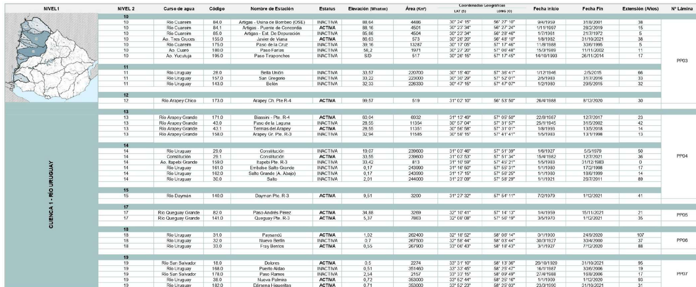
■ TABLA 5. Lista de estaciones hidrométricas Cuenca Nivel 1 Río Uruguay