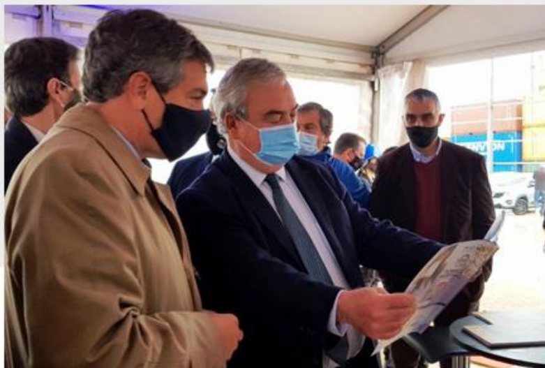
Luis Alberto Heber.