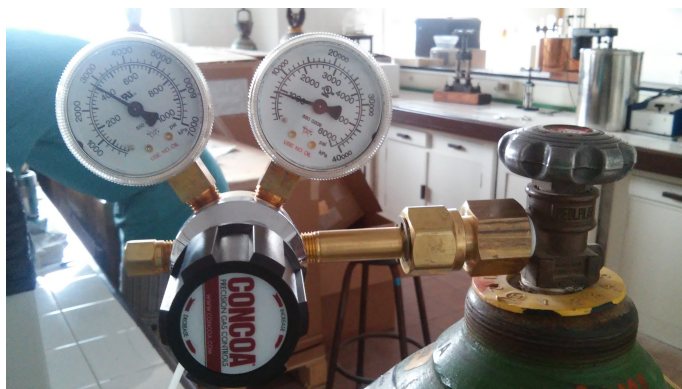
Figura 6: Reguladora de presión