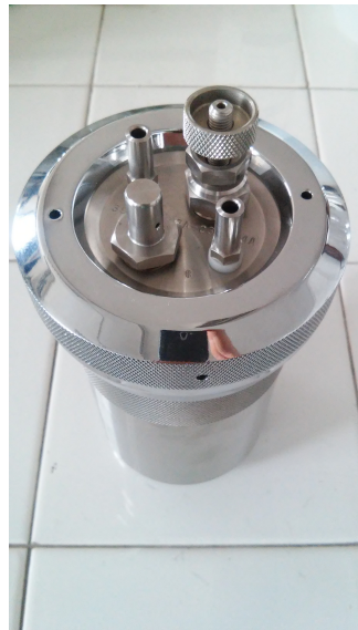
(a) Bomba calorimétrica