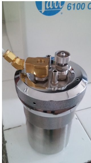
(b) Bomba con línea de O 2