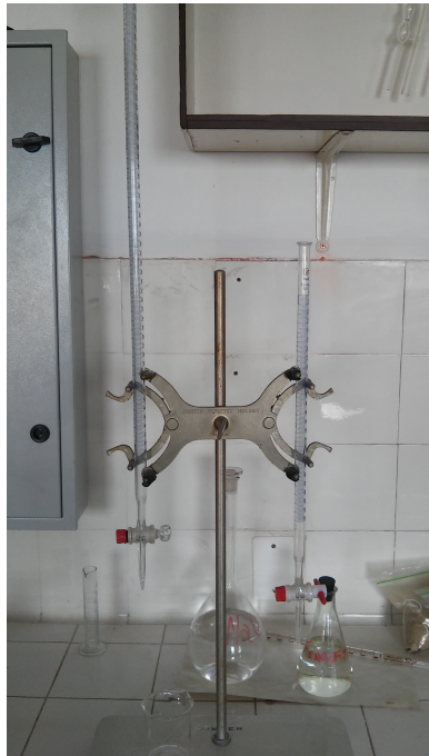
Figura 7: Buretas graduadas