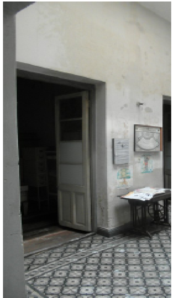
Località pianta, buia al fondo