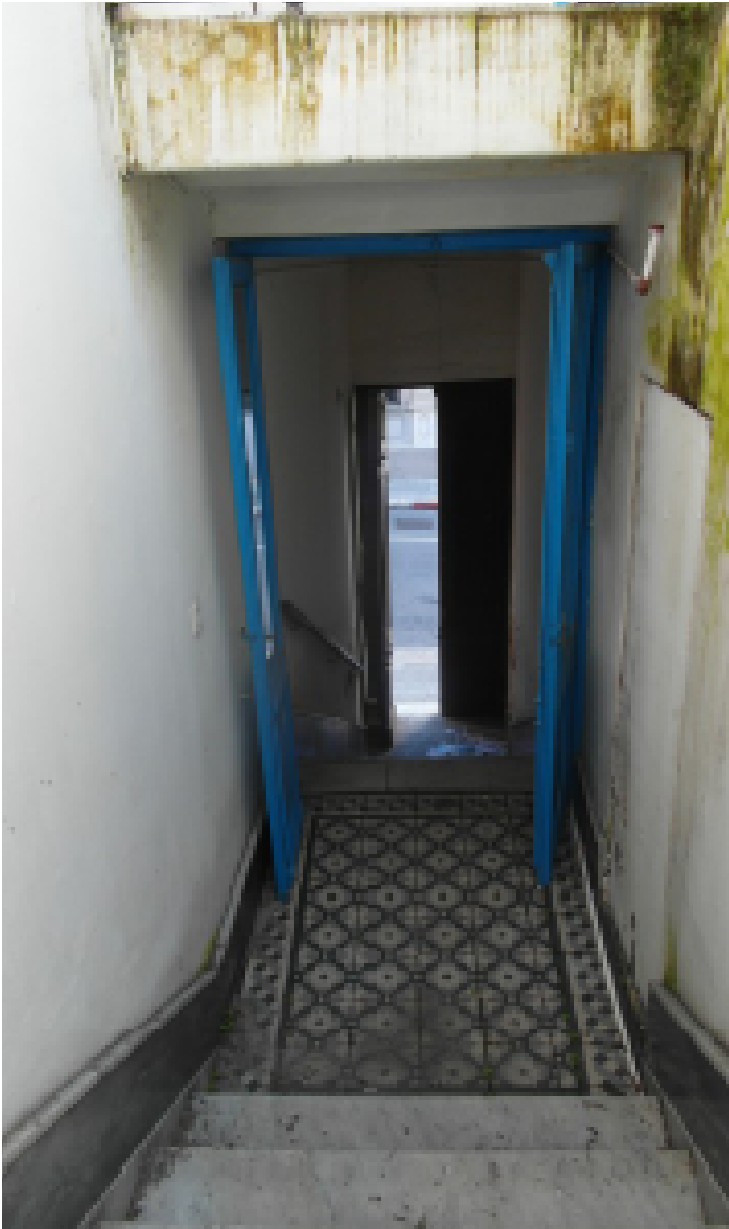
Accesso a planta alta