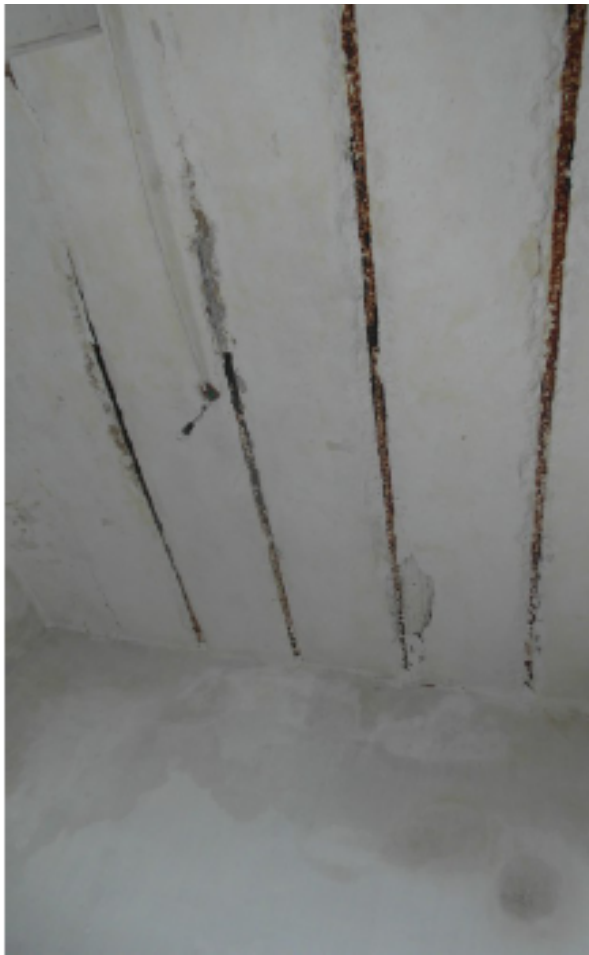
Detalle de cubierta