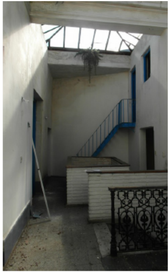
Llegada a primer